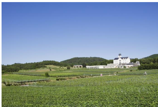
中伊豆ワイナリーヒルズ

タオル 110 円 バスタオル 220 円 作務衣 325 円 セット 540 円