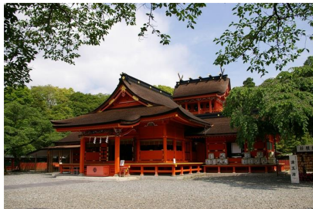
富士山本宮浅間大社

《出発日当日の緊急連絡先 080-5136-4291 ※当日の緊急時以外はご遠慮ください》