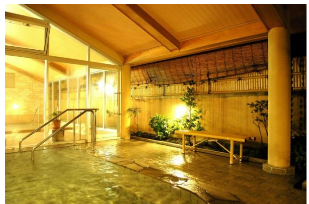
ホテルワイナリーヒル

《出発日当日の緊急連絡先 080-5136-4291 ※当日の緊急時以外はご遠慮ください》